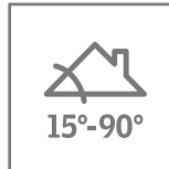
Pose sur rampant de toiture

Permet d'agrandir le couloir latéral dans le cas d'installation avec tuile canal si besoin.