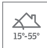
Pose verrière d'angle