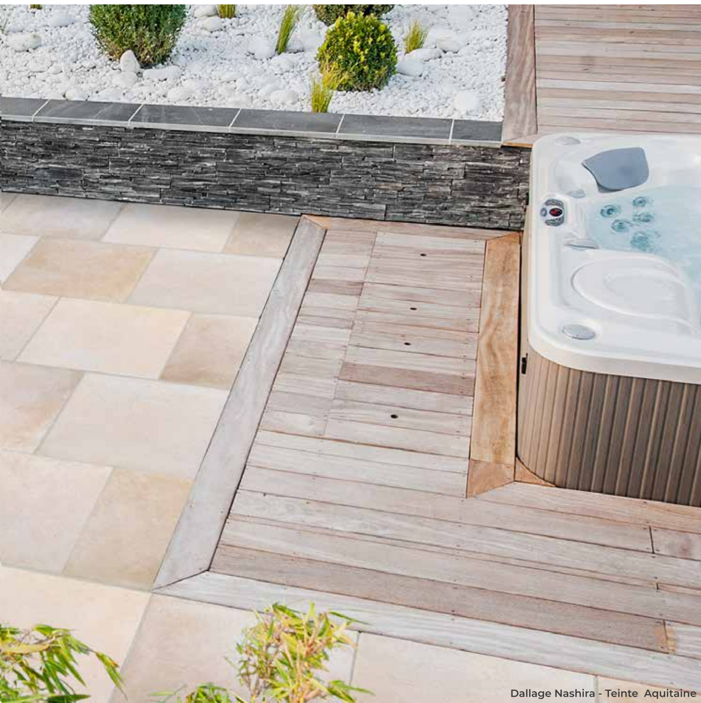
Dallage Nashira - Teinte Aquitaine