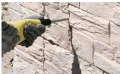
Jointer à la poche à joints.

Prévoir des joints de fractionnement tous les 60 m 2 .