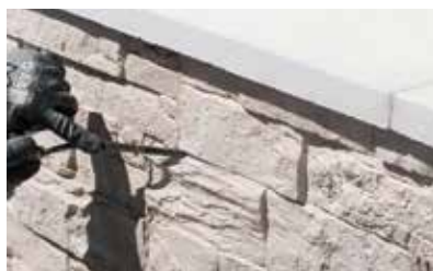
Lisser à l'aide d'un fer à joints.

Nos parements ne nécessitent pas d'entretien particulier.