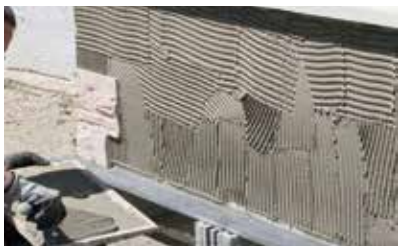
Double encollage obligatoire.