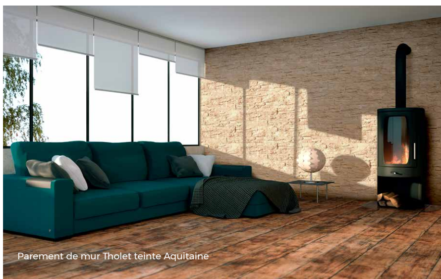
Parement de mur Tholet teinte Aquitaine