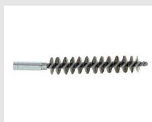
Eurocode 052976 Ecouvillon D.26