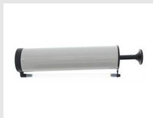
Eurocode 065990 Soufflette de nettoyage