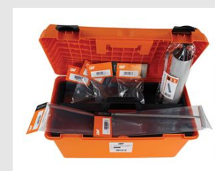
Eurocode 055832 Kit de nettoyage manuel