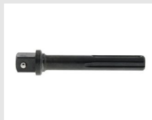
Eurocode 151500 Outil de pose tiges MAXIMA+ 20-24-30