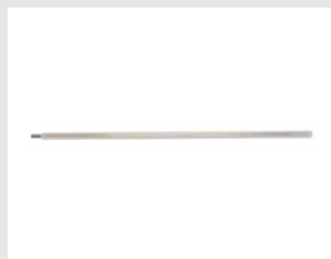
Eurocode 051010 Rallonge L325