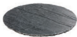
Pas japonais (rond)