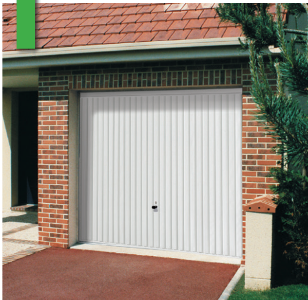
Porte basculante EuroPro motif 132, RAL 9016

Conditionnement : palette de 6 ou 12 portes.