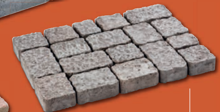
Pavage Catalan , finition martelé à retrouver en P.104