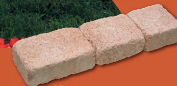
Pavé Floréal , à retrouver en P.114

Retrouvez plus d'infos sur le site en flashant ce code avec votre smartphone.