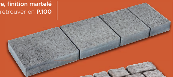
Pavé Navarre , finition martelé à retrouver en P.100

Fabriqués 100% localement, à froid et séchés à l'air naturel dans des sites industriels français à proximité de carrières, commercialisés dans les négoce en matériaux proches des lieux d'utilisation, les produits en béton pressés sont entièrement recyclables et sont en phase avec les critères de préservation de l'environnement.